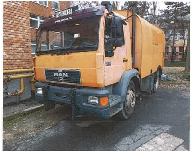
2, A GUL-188 forgalmi rendszámú tehergépkocsi