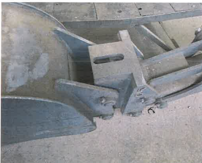
19, GF mélyásó szerelék E280 (280E200) gyorscsatlakozóval + bontókalapács felfogató