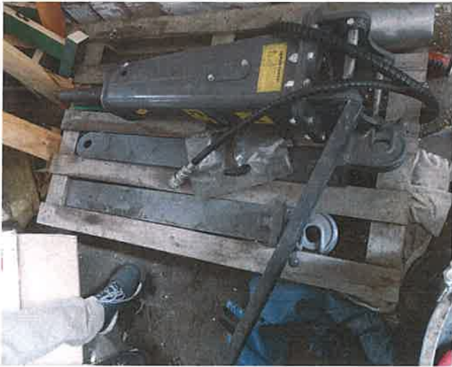
25, MH 90 S bontókalapács gyorscsatlakozóval