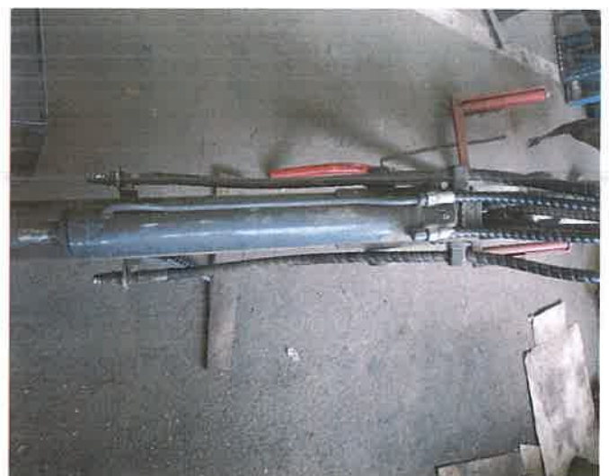
18, GF mélyásó szerelék E280 (280E200) gyorscsatlakozóval