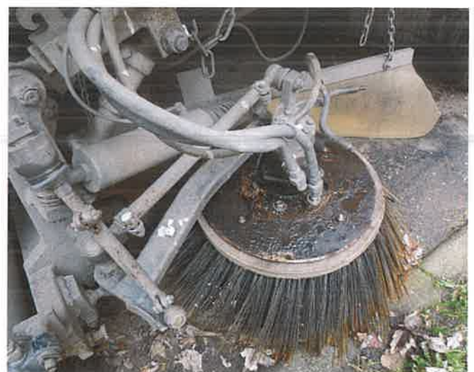
6, A GUL-188 forgalmi rendszámú tehergépkocsi seprő része