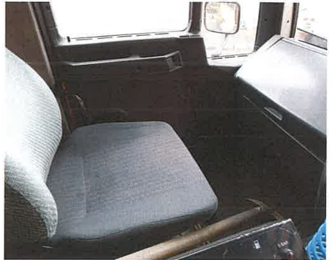
14, A GUL-188 forgalmi rendszámú tehergépkocsi vezetőfülkéje