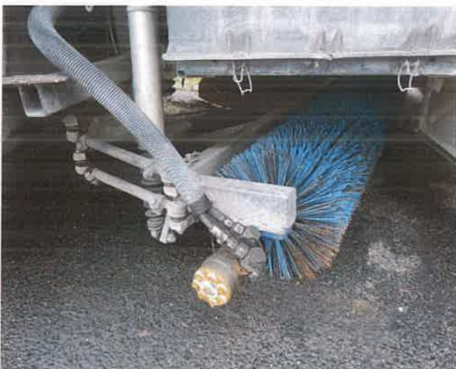
5, A GUL-188 forgalmi rendszámú tehergépkocsi seprő része