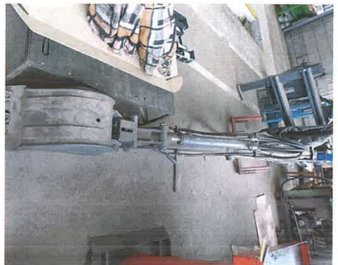
16, GF mélyásó szerelék E280 (280E200) gyorscsatlakozóval