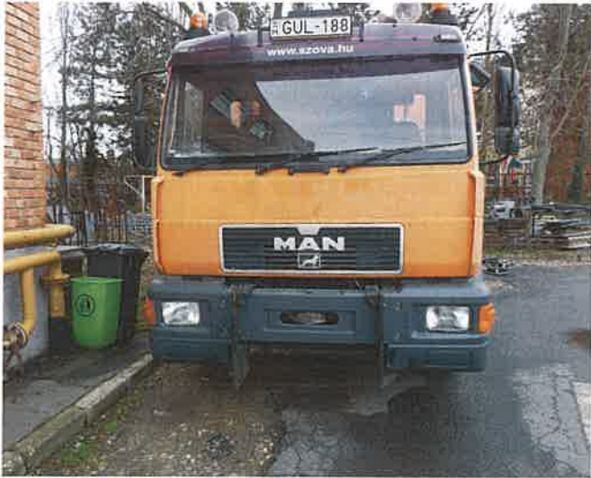
1, A GUL-188 forgalmi rendszámú tehergépkocsi