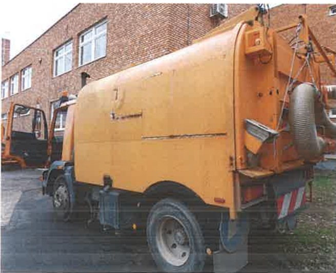
3, A GUL-188 forgalmi rendszámú tehergépkocsi