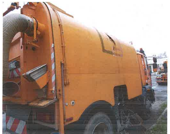
4, A GUL-188 forgalmi rendszámú tehergépkocsi