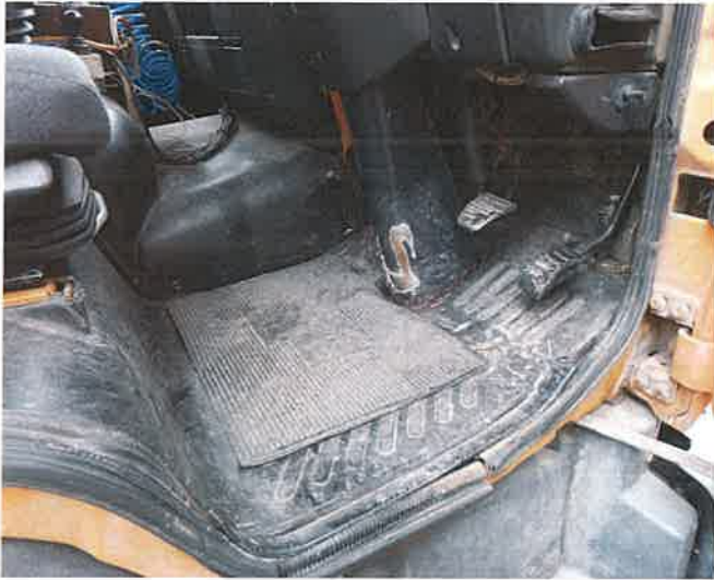
13, A GUL-188 forgalmi rendszámú tehergépkocsi vezetőfülkéje