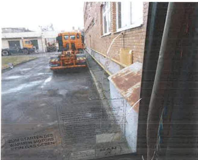
15, A GUL-188 forgalmi rendszámú tehergépkocsi első szélvédője